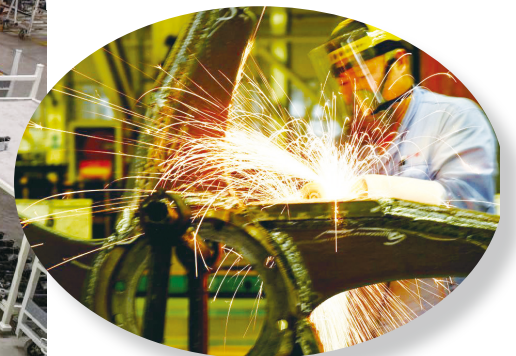
▲10月9日,在河北石家庄装备制造产业园,技术人员在石家庄煤矿机械有限公司装配车间忙碌。