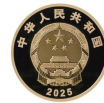
150克圆形精制金质纪念币正面图案