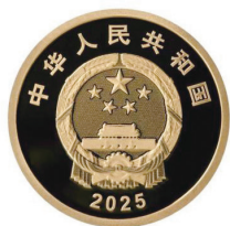
3克圆形精制金质纪念币正面图案