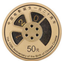
3克圆形精制金质纪念币背面图案