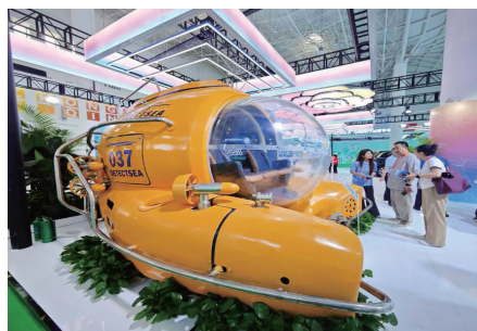
第六届消博会国货精品展区重庆馆内展出的潜水器“饺子”。