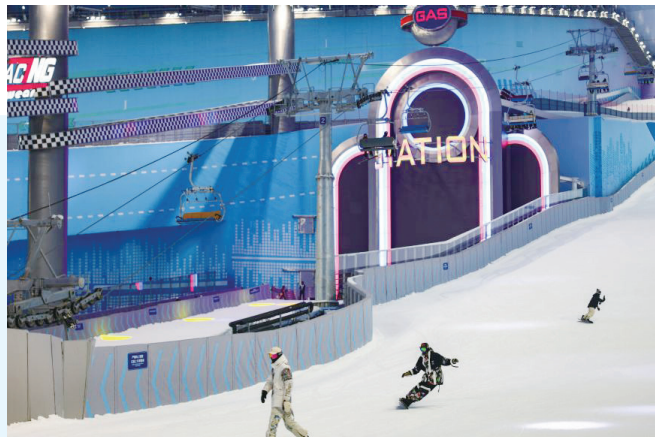
4月1日，滑雪爱好者在长春万达滑雪场滑雪。