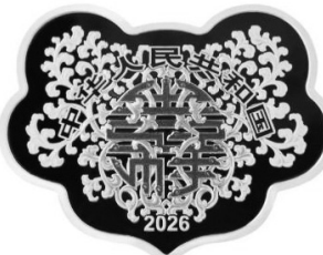
30 克如意形精制银质纪念币正面图案