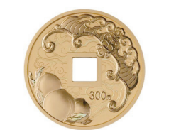
20 克方孔圆形精制金质纪念币背面图案