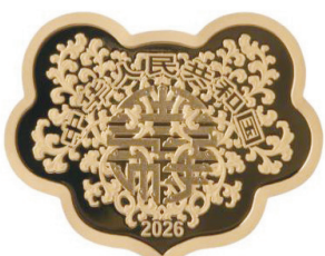
5 克如意形精制金质纪念币正面图案

该套金银纪念币正面图案均为“吉祥”文字造型，衬以中国传统吉祥纹饰，并刊国名、年号。