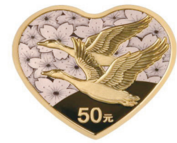
3 克心形精制金质纪念币背面图案