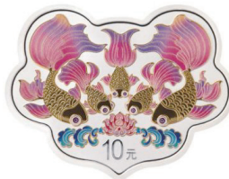
30 克如意形精制银质纪念币背面图案

30 克如意形银质纪念币背面图案为鱼、吉祥花卉、卷草纹等装饰组合设计，并刊面额。