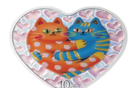
30 克心形精制银质纪念币背面图案