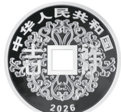
30 克方孔圆形精制银质纪念币正面图案