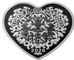
30 克心形精制银质纪念币正面图案