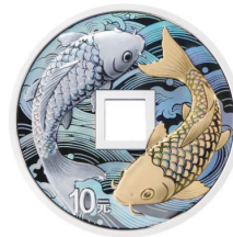
30 克方孔圆形精制银质纪念币背面图案