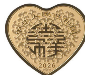
3 克心形精制金质纪念币正面图案