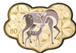
5 克如意形精制金质纪念币背面图案

5 克如意形金质纪念币背面图案为母子鹿、吉祥花卉、几何线条等装饰组合设计，并刊面额。