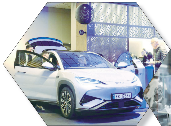
2026年5月7日，在挪威首都奥斯陆举行的第三届中挪绿色合作研讨会期间，与会人士体验中国品牌电动车。