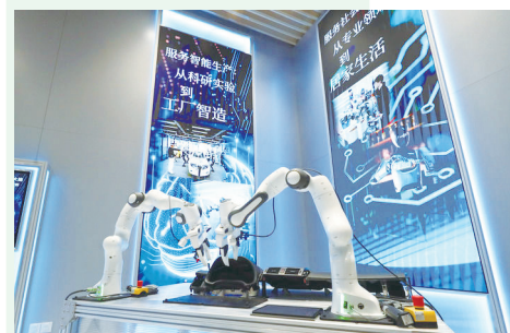
2025年4月29日拍摄的位于上海市徐汇区的“模速空间”内展示的人工智能产品。