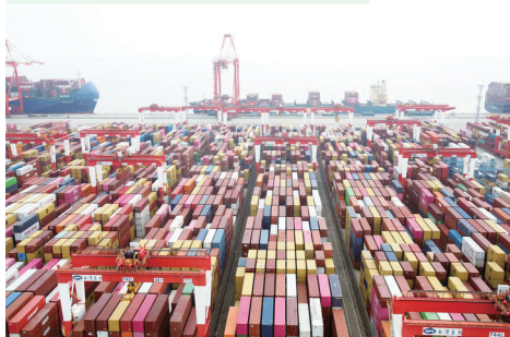
2026年4月1日拍摄的上海洋山深水港四期自动化码头。