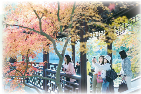
2025年12月1日，游客在江苏省昆山市亭林园赏枫拍照。